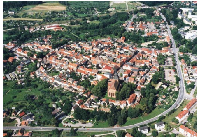
Abb. 1: Mittelalterlicher Stadtgrundriss von Sternberg