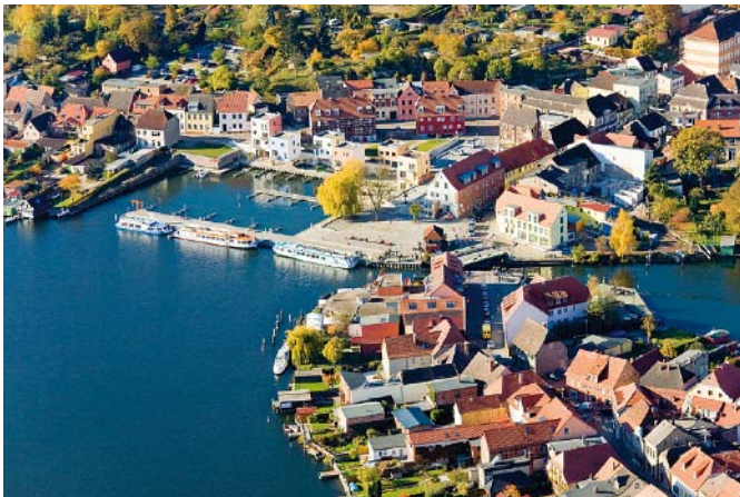
Abb. 3: Malchow: Erfolgreiche Umsetzung des Projektes Stadthafen

DDR-Zeiten ebenfalls einen Einwohnerverlust (auf 6.866 Einwohner zum 31.12.2009) zu verzeichnen. Neben den Bemühungen um Gewerbeansiedlung und der Aufrechterhaltung von Bildungs- und Sozialinfrastruktur liegt ein Schwerpunkt in Malchow auf einer eigenständigen Entwicklung des touristischen Profils mit hoher städtebaulicher und architektonischer Qualität. Die Ansiedlung touristischer Einrichtungen ist dabei nicht nur ein den Arbeitsmarkt belebender Faktor, sondern entwickelt entsprechenden „Sanierungsdruck“ auf öffentliche Räume und Gebäude. So hatten die Stadtverantwortlichen den Mut, eine zentral gelegene Brache zu einem Stadthafen umzugestalten. Der Entwurf des Büros Steidle und Partner, hervorgegangen aus einem Wettbewerb aus dem Jahr 2000, ist mit erheblicher Anstrengung der kommunalpolitischen Akteure als öffentlich-privates Partnerschaftsmodell 2009 umgesetzt worden. Diese Investition in die touristische Infrastruktur bewirkt, dass Immobilien in Malchow stärker nachgefragt werden und ehemalige Industriearmale, am Wasser gelegen, das Interesse von Investoren wecken.