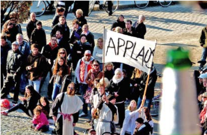
Abb. 3: Herausforderung Kommunikation

offenen agenda setting. Offenes agenda setting bedeutet im Kontext des Städtenetzwerkes, dass analytisch fundierte und nachgewiesene Themenerfordernisse sowie die grundsätzlich von allen Akteuren vorschlagbaren Themen transparente, sachliche Filterprozesse im Dialog der Akteure untereinander durchlaufen, die letztlich zu einer einvernehmlich abgestimmten Tagesordnung führen.