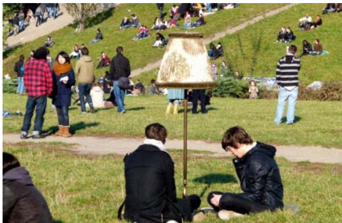
Abb. 2: Kommunikation auf Augenhöhe geht überall – hier im Berliner Mauerpark