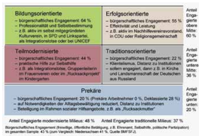
Abb. 2: Milieus und bürgerschaftliches Engagement

Und sie wollen an der deutschen Gesellschaft teilhaben und sich mit ihren Möglichkeiten in Alltag und Beruf einbringen (s. Abb. 2). Die in der Studie Befragten engagieren sich zu 40% mit freiwilligen bürgerschaftlichen Tätigkeiten. Dabei zeigt sich, dass das Engagement der neuen Bürger einer quantitativ und qualitativ zwischen den Milieus differenzierten Praxis folgt. Der Anteil der ehrenamtlich Aktiven hängt – wie auch in der übrigen Mehrheitsgesellschaft – zum einen von der vertikalen Position und sozialen Raum und damit von der Verfügung über soziale Ressourcen ab. Die Befragten aus den unteren sozialen Milieus („Prekäre“) engagieren sich zu einem Fünftel bürgerschaftlich, in der unteren Mitte („Teilmodernisiert“, „Traditionsorientierte“) zu knapp zwei Fünfteln und in den Milieus der oberen Mitte („Bildungsorientierte“, „Erfolgsorientierte“) zu drei Fünfteln.