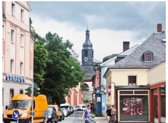
Abb. 2: Kirche in der Stadt: St. Lorenz-Kirche in Hof/Oberfranken

Als wichtige Vermittler zwischen Kirchengemeinden oder örtlichen Verbandsstrukturen und der Landesebene bis hin zur Bundesebene haben sich die Vertreter der jeweiligen „mittleren“ Handlungsebene in den Landeskirchen bzw. -verbänden, Seelsorgeämtern der (Erz-)Diözesen, Diözesan-/Landescaritasverbänden sowie den Fachverbänden herausgestellt. Gegenüber den meist nach Fachressorts und Zielgruppen organisierten Verwaltungsstrukturen ist hier der Querschnittsansatz eines zielgruppen- und handlungsfeldübergreifenden Handelns mit einem sozialräumlichen Bezug stärker zu verankern.