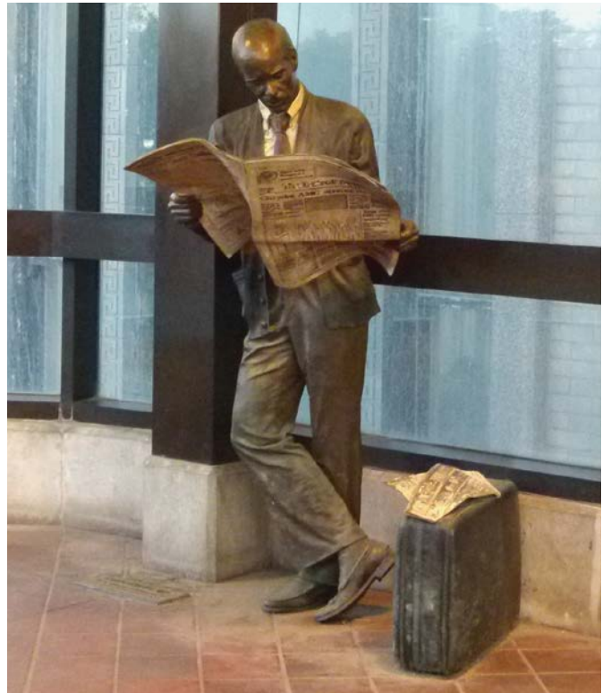
Abb. 3: ... auch mal in Ruhe gelassen werden – hier in Detroit

dismus hat auch die Idee einer Idealstadt stets etwas Autoritäres an sich – selbst wenn das den Intentionen der Akteure widersprechen mag. Das Urbane jedenfalls, die Kooperationsfähigkeit von nicht Koordiniertem ist nicht im Fokus solcher Ideen.