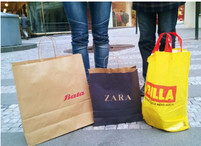
Abb. 1: Simultane Erfahrung von Verschiedenem – hier in Prag

vendifferenz oder das himmlische Jerusalem als der Ort, an dem die Einheit der Verheißung gestiftet wird 1 , stets sind es Städte, an denen sich das Problem der Differenzerzeugung und der Einheitsstiftung stellt. Und es waren ohne Zweifel Städte als räumliche Verdichtungen des Sozialen, in denen sich und an denen sich gesellschaftlicher Wandel und evolutionäre Prozesse niederschlugen. Exakt in diesem Sinne stellt sich die moderne Gesellschaft als eine stadtnahe Gesellschaft dar – zumindest in ihren in erster Linie politisch formierten Selbstbeschreibungen, die schon im Begriff des Politischen das Städtische der polis enthalten. Insofern haben sich Städte tatsächlich als Laboratorien der Moderne dargestellt, als die Orte, an denen sich jene funktional ausdifferenzierten Zentren der Gesellschaft – Ökonomie, Politik, Recht, Religion, Bildung, Kunst und Wissenschaft – begegnen und aufeinander bezogen werden. Städte sind in diesem Sinne nicht, wie etwa René König (1958) für die Gemeinde als Grundform der Gesellschaft meinte, „Gesellschaft auf lokaler Basis“ – das stimmt schon für stadtferne Siedlungsformen nicht, nicht einmal für die Vormoderne –, sondern umgekehrt: Lokalität auf gesellschaftlicher Basis . In städtischen Räumen verdichten sich also gesellschaftliche Strukturen, Differenzierungen und Routinen an einem Ort – und lassen damit Differenzierung besonders hervortreten.