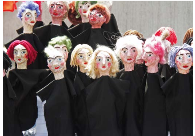
Abb. 2: Lebenswelten und Kulturen erfordern eine adäquate Ansprache

deutschen) Mitmenschen an der eigenen Kultur und Religion äußerten, was wiederum dazu führte, dass sich die Ansicht verfestigt hat, dass ihre Meinung in vielen Dingen auch nicht gefragt sei. Dass Beteiligungsprozesse der Stadt aber durchaus von den Meinungen aller Bürger in der Stadt lebt und profitiert, war den Gesprächspartnern oft nicht bewusst. Hier wurde vor allem auch betont, dass, wenn ihre Meinung wirklich wichtig ist, auch auf eine adäquate Ansprache geachtet werden muss, die auch der eigenen Herkunft, Kultur und Religion Respekt und Akzeptanz entgegenbringt.