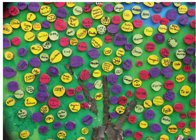
Abb. 3: Die Vielfalt der Stadtgesellschaft abbilden

Im Vorgehen in der Mannheimer Neckarstadt-West lag der Fokus für die Interviews auf ganz bestimmten Bürger- und Milieugruppen. Dadurch entstand eine sehr homogene Stichprobe, die Einblicke in Sichtweisen und Einstellungen eben dieser speziellen Gruppen ermöglichte. In Berlin ließ sich in der Zusammenarbeit mit den Stadtteilmüttern, Vereinen und Institutionen vor Ort jedoch eine sehr heterogene Stichprobe erzeugen. So wurden ganz unterschiedliche Perspektiven und Sichtweisen auf den betreffenden Stadtteil generiert und damit auch ganz unterschiedliche Erklärungsmuster und Lösungsansätze für wahrgenommene Probleme. So werden wiederum potenzielle Konflikte zwischen einzelnen Bürgergruppen im Quartier deutlich, mit denen im Beteiligungsprozess umgegangen werden muss.