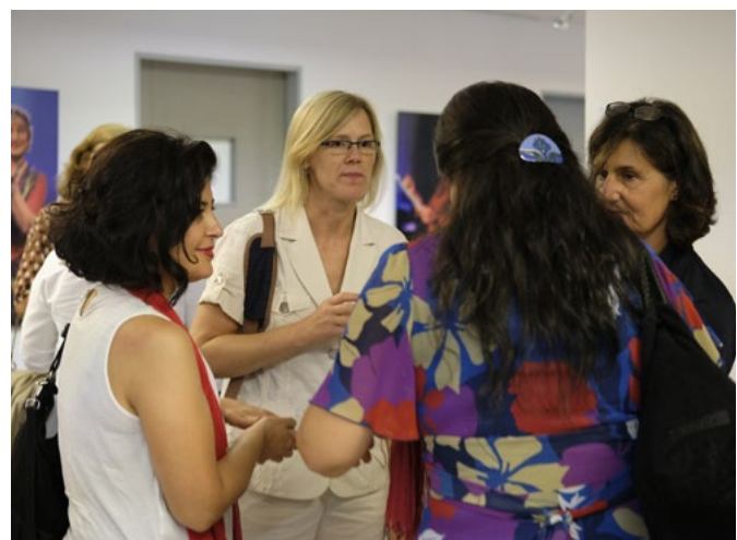
Abb. 3: Tagung „Stadtteilmütter – Netzwerkerinnen mit Wirkung“ vom September 2018

Betrachtet man das Zusammenspiel der größeren Netzwerke der Stadtteilmütter, deren Kontakte in ganz unterschiedliche gesellschaftliche Kreise hineinreichen, mit den überschaubaren Kontakten ihrer Klientinnen, wird deutlich, dass Stadtteilmütter als Katalysatoren (lokaler) sozialer Netzwerke fungieren: Über den (einen) Kontakt zur Stadtteilmutter steht der