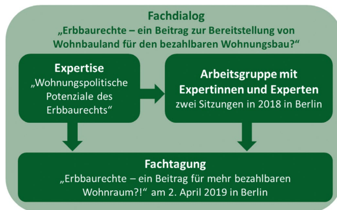
Abb. 3: Bausteine des Fachdialogs Erbbaurecht

Für den bezahlbaren Mietwohnungsbau und weitere wohnungspolitische Ziele muss von Fall zu Fall geprüft werden, ob der Erbbauzins (weiter) verringert und wie eine geeignete Kombination mit der sozialen Wohnraumförderung gestaltet werden kann. Voraussetzungen sind entsprechende haushaltsrechtliche Rahmenbedingungen sowie die Beachtung des EU-Beihilferechts analog zur verbilligten Abgabe von Liegenschaften. So ist zu berücksichtigen, dass bei vergünstigten Erbbauzinsen für geförderten Wohnungsbau beihilferechtlich keine Überkompensation/Doppelförderung erfolgt.