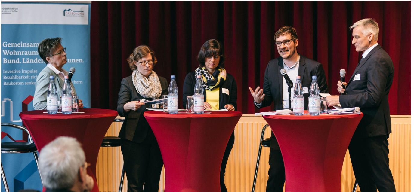
Abb. 4: Diskussionsrunde bei der Fachtagung zum Erbbaurecht 2019 in Berlin

Mit Blick auf die Eingangsfrage lässt sich folgendes Fazit des Fachdialogs ableiten: