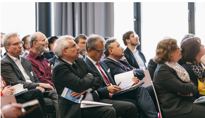
Abb. 5: Publikum der Fachtagung zum Erbbaurecht 2019 in Berlin

Nagel, M. (2017): Erbbaurecht: Ein Klassiker. In: Nagel, M. (Hrsg.): Erbbaurecht. Neue Perspektiven auf einen Klassiker. Rote Seiten 03.17.