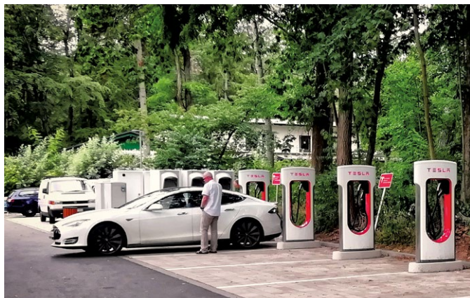
Abb. 1: Elektroladestationen in Beelitz-Heilstätten

Verhältnismäßigkeit messen lassen. 8 Dies kann im Einzelfall zu einer erheblichen rechtlichen Hürde werden.