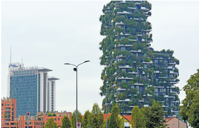
Abb. 2: Wohnturm „Bosco Verticale“ in Mailand

gulierung führen. 15 Im Bebauungsplan kann Dachbegrünung nach § 9 Abs. 1 Nr. 25 BauGB verbindlich festgesetzt werden. Denn § 9 Abs. 1 Nr. 25 BauGB ermöglicht die Festsetzung der Bepflanzung von Teilen baulicher Anlagen mit Bäumen, Sträuchern und sonstiger Bepflanzung. Daneben kommt ebenfalls eine Gestaltungsatzung nach den Landesbauordnungen in Betracht.