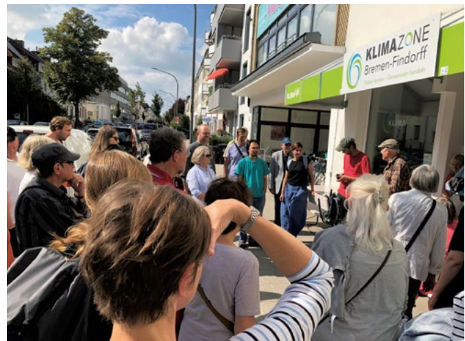
Abb. 2: KlimaCafé als zentrale Anlaufstelle im Quartier für Veranstaltungen und neue Ideen

in der Woche als Nachbarschaftstreff ein. Bürgerinnen und Bürger können bei Kaffee und Kuchen ins Gespräch kommen, neue Ideen entwickeln und Aktionen planen. Das KlimaCafé wird von Freiwilligen aus dem Quartier betreut. Themen in der Klimazone reichen von energiesparendem Wohnen und autofreier Mobilität bis hin zu Müllvermeidung und Kleidertauschbörsen. Aber auch Maßnahmen der Hitzeanpassung werden bearbeitet. Zum einen sollen Entsiegelungs- und Begrünungsprojekte helfen, die zunehmende Hitzebelastung in Findorff zu mindern. Zum anderen werden Fassaden- und Dachbegrünungen umgesetzt. Die Stadtteilbewohner werden dabei von Fachleuten und Organisationen begleitet. Experten aus der Umweltberatung zeigen beispielsweise auf, wo Maßnahmen durchgeführt werden können oder geben Tipps zur Pflanzenwahl und Pflege. Bei Entsiegelungen beteiligt sich der Bremer Senator für Umwelt, Bau und Verkehr, indem er großflächige Vorhaben finanziell bezuschusst. (Vgl. Klimazone Bremen Findorff 2019)