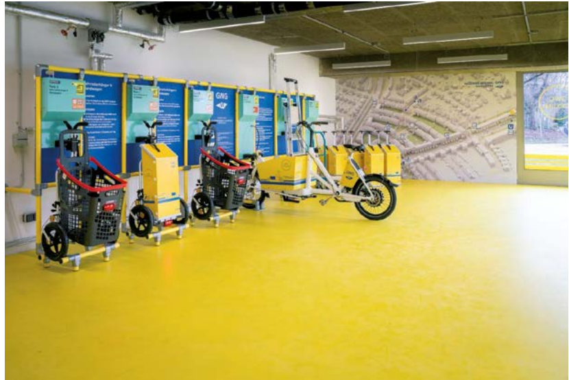
Abb. 3: Innenansicht einer GWG Mobilitätsstation

Die Carsharinganbieter bringen in der Regel ihr Buchungssystem mit, zu dem sich die Bewohner anmelden. Gegebenenfalls ist vom Bauherrn eine Lizenzgebühr zu entrichten. Besonders einfach für die Bauherren sind Anbieter, die neben Pkw auch andere Fahrzeuge, wie Fahrräder, in das Buchungssystem integrieren können. Während der Nutzerkreis für einige Elemente offen ist, kann die gemeinschaftliche Nutzung der Pedelecs oder Lastenräder auch nur einem geschlossenen Nutzerkreis zur Verfügung gestellt werden. Vorstellbar ist die Eingrenzung auf die Bewohner eines Gebäudes, einer Wohnanlage oder eines Quartiers. Wird eine derartige Möglichkeit