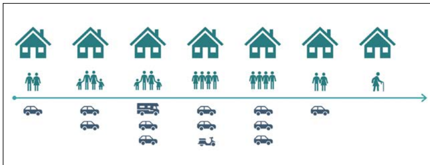
Abb. 2: Veränderter Stellplatzbedarf im Lebenszyklus einer Familie (stattbau münchen GmbH)

Pkw“, „im geförderten Wohnungsbau sieht das auch nicht anders aus“ oder „Carsharing bringt gar nichts. Habe ich neulich noch in einem Fernsehbeitrag gesehen!“