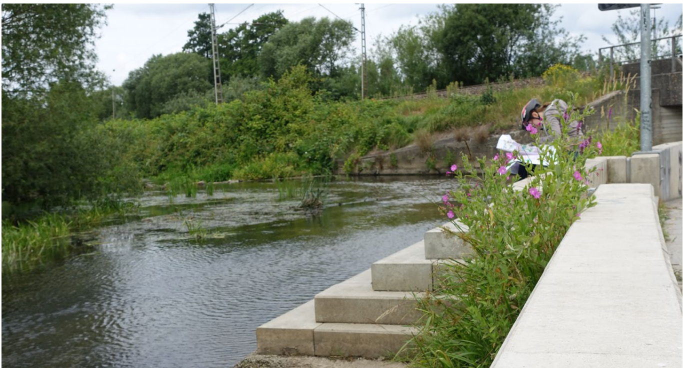
Abb. 1: Multifunktionale urbane grün-blaue Infrastruktur

Der Begriff nimmt zunächst Bezug auf die EU-Initiative zur „Grünen Infrastruktur“. Diese stellt die Weichen für „ein strategisch geplantes Netzwerk wertvoller natürlicher und naturnaher Flächen“ mit einem breiten Spektrum an Ökosystemleistungen und bezieht sowohl ländliche als auch urbane Räume ein (EC 2014, S. 7). Mit der EU-Initiative gehen ein Perspektivwechsel und ein Bedeutungszuwachs einher, weil er die Ausstattung der Städte mit blauen und grünen Räumen und Strukturen auf eine Ebene mit technischer und sozialer Infrastruktur stellt (Hansen et al. 2019, S. 11).