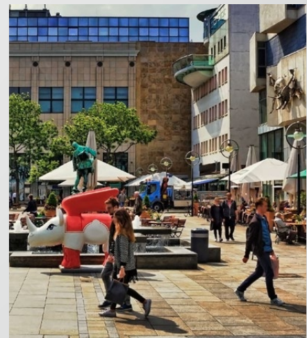
Abb. 3: Dortmunder Innenstadt