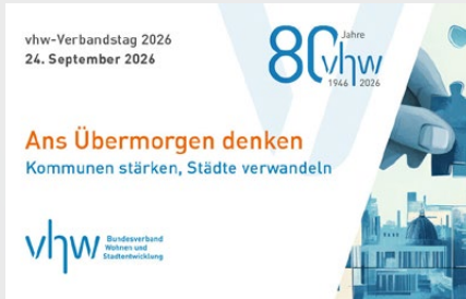
Abb. 1: vhw-Verbandstag am 24. September 2026