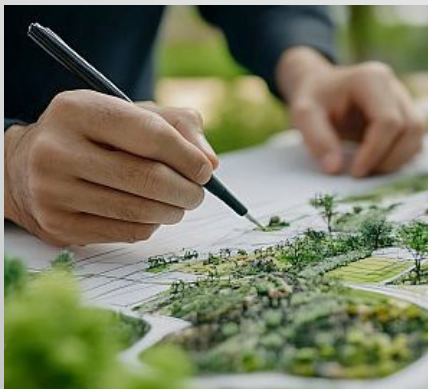
Abb. 2: vhw-bdla-Kooperation

Ab März 2026 beginnt die Kooperation zwischen dem vhw und dem Bund Deutscher Landschaftsarchitekten (bdla) für vhw-Bildungsangebote vor allem zu den Themen Umweltrecht und Klimaschutz, Städtebaurecht, Vergabe- und Bauvertragsrecht, Stadtentwicklung und unseren Softskillthemen. Wir freuen uns auf die Zusammenarbeit, denn mit dem bdla wurde ein Partner gewonnen, der mit Politik, Verwaltung, Wirtschaft und Öffentlichkeit im Gespräch ist und bei bau- und planungsrelevanten Gesetzesvorhaben seine Expertise einbringt.