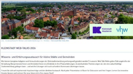
Abb. 4: Kleinstadt-Web-Talks beim vhw

Die erfolgreiche kostenfreie Webinarreihe „Kleinstadt-Web-Talks“ wird fortgesetzt. Die Kleinstadt-Akademie hat die Finanzierung für weitere Veranstaltungen zugesagt und das Fördervolumen erhöht. Inhaltlich werden die Themen stärker gebündelt. Die ersten vier Termine greifen zentrale Fragestellungen rund um Mobilität sowie Innenentwicklung und Leerstand auf. Neu ist außerdem eine Verlängerung der Webinare von 60 auf 90 Minuten, um mehr Raum für Praxisbeispiele und Austausch zu