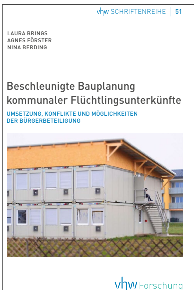
Abb. 1: Titelseite der vhw-Publikation „Beschleunigte Bauplanung kommunaler Flüchtlingsunterkünfte – Umsetzung, Konflikte und Möglichkeiten der Bürgerbeteiligung“

Die Studie verdeutlicht, dass alle untersuchten Kommunen den § 246 BauGB nutzen, um temporären oder dauerhaften Wohnraum für Geflüchtete zu schaffen. Besonders häufig