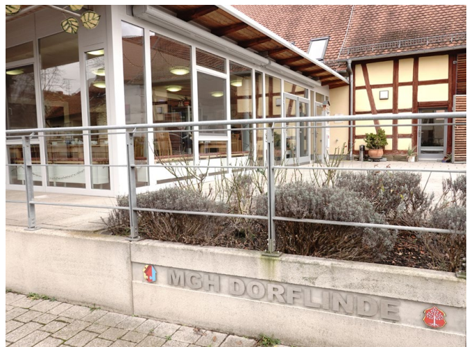
Abb. 4: Das Mehrgenerationenhaus Dorflinde in Langenfeld

Die Leitlinien skizzieren eine integrierte, kommunal gesteuerte Strategie, die das Alter in Kleinstädten nicht nur als „Pflege- und Versorgungsaufgabe“, sondern als zentrale Dimension der langfristigen städtischen Entwicklung begreift.