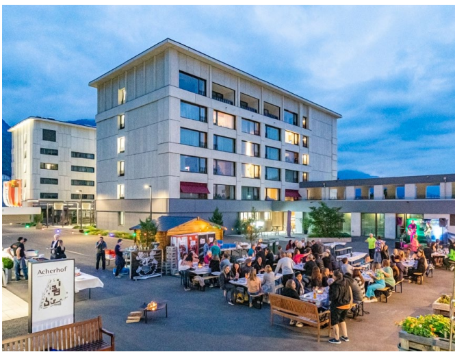
Abb. 3: Die „Acherhof-Piazza“

Was die Beispiele gemeinsam haben, ist der Fokus auf die lokale Nähe und das Gemeinschaftliche: Wohnen im Alter gelingt dort besonders gut, wo Kommunen, Wohnungsträger, Wohlfahrtsverbände sowie Bürgerinnen und Bürger die Verantwortung teilen und sich auf das konzentrieren, was in Kleinstadtquartieren und dörflichen Ortsteilen wirklich für das Leben im Alter gebraucht wird.