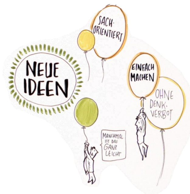
Abb. 2: Stadtmachen – „Neue Ideen“, die durch ihr lösungsorientiertes Potenzial symbolisieren, dass es auch „anders“ geht, Grafik: Kellner 2018

Kommunen getragenen Gemeinschaftsinitiativen Nationale Stadtentwicklungspolitik zur förderfähigen Akteursgruppe avanciert – nicht zuletzt über den Projektauftrag „Stadt