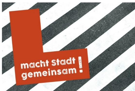
Abb. 1: Das Leitbild der Neuen Leipzig Charta (BMI 2020a)

„Macht Stadt gemeinsam“ (BMI 2020a) – so lautet die Leitidee der Neuen Leipzig-Charta, die das Ziel einer nachhaltigen und gemeinwohlorientierten Stadtentwicklung postuliert (BMI 2020b). Angesichts der Herausforderungen, vor denen Städte und Gemeinden bei dieser Zielorientierung stehen, werden alle gesellschaftlichen Akteure zur Zusammenarbeit aufgefordert: unter Einbeziehung aller Regierungsebenen und Schlüsselakteure, auch seitens der Zivilgesellschaft (ebd.). Das scheint ein sehr vernünftiger – und zudem