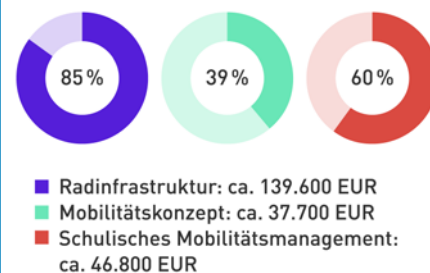
Kostenverteilung und Förderanteile in %

Die Gemeinde setzt bei der Finanzierung der Maßnahmen auf Fördermittel von Bund und Land. Die bisherigen Ausgaben verteilen sich im Schwerpunkt wie folgt: