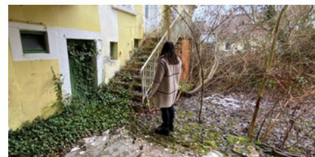
Dorfumbau-Management, N. Miller

Die Geschäftsstelle Kleinstadt Akademie wird durch das Bundesministerium für Wohnen, Stadtentwicklung und Bauwesen gefördert und durch das Bundesinstitut für Bau-, Stadt- und Raumforschung im Bundesamt für Bauwesen und Raumordnung begleitet.