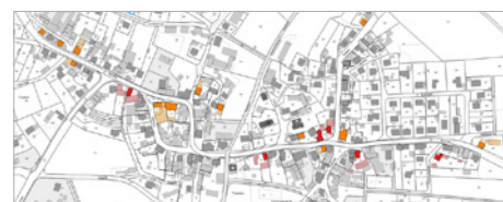
Baulücken- & Leerstandskataster

Die Geschäftsstelle Kleinstadt Akademie wird durch das Bundesministerium für Wohnen, Stadtentwicklung und Bauwesen gefördert und durch das Bundesinstitut für Bau-, Stadt- und Raumforschung im Bundesamt für Bauwesen und Raumordnung begleitet.