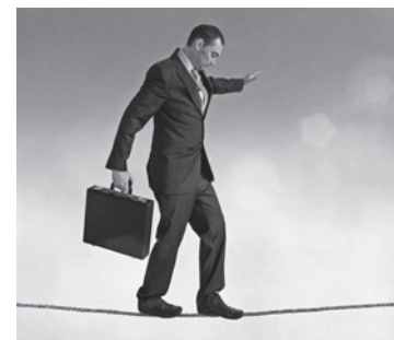
Titelmotiv: © iStock.com