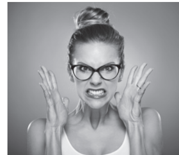
Titelmotiv: © iStock.com